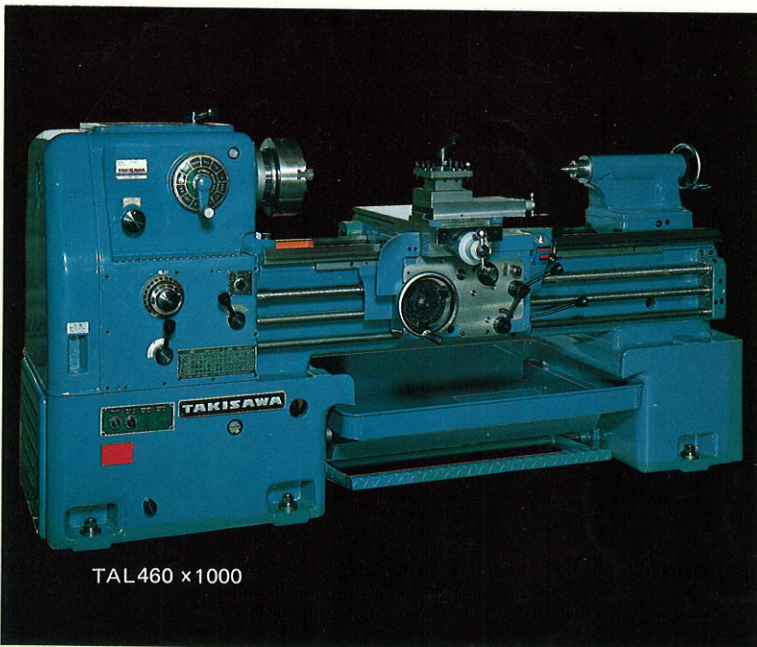
TAL460 x 1000

642 Anthony Trail, Northbrook, Illinois 60062 Telephone:(312)480-9557 Telex: TWX9106860040